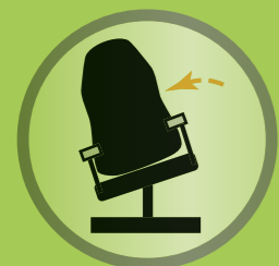
Seitliche Sitzkantelung ermöglicht eine beidseitige Neigung des Sitzsystems von bis zu 15 Grad