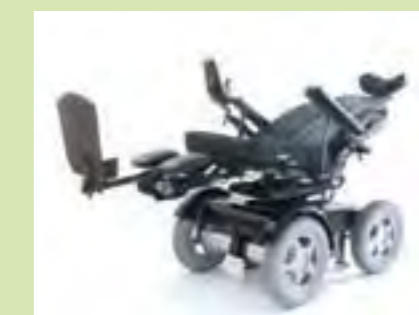
Elektrische Beinstütze: Im Zusammenspiel mit anderen Funktionen wird eine beinahe liegende Position erreicht