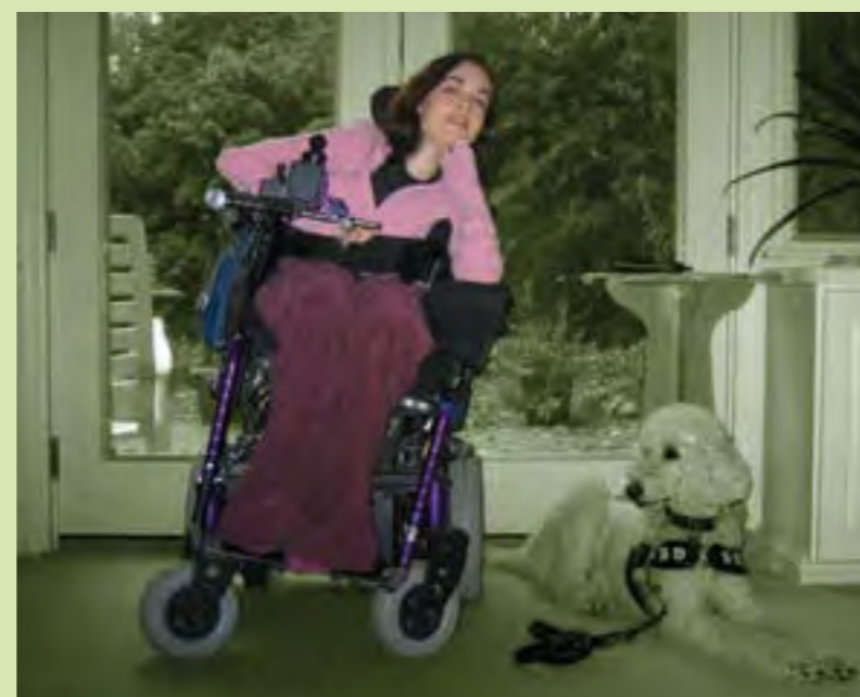
Kindgerecht: Die Sitzsysteme bieten auch jungen Nutzern sämtliche Einstellmöglichkeiten