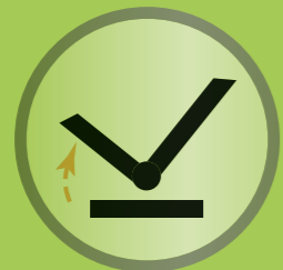
Sitzkantelung mit Schwerpunkttausgleich