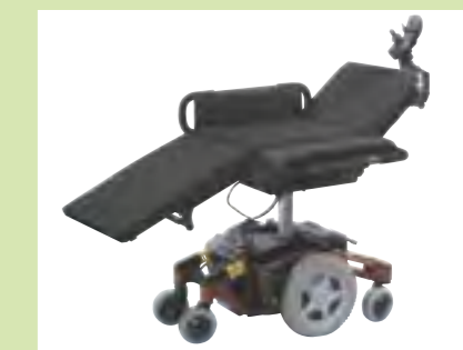
Horizontale Positionierung: Liegende Fortbewegung für mehr Mobilität mit extremer Druckempfindlichkeit