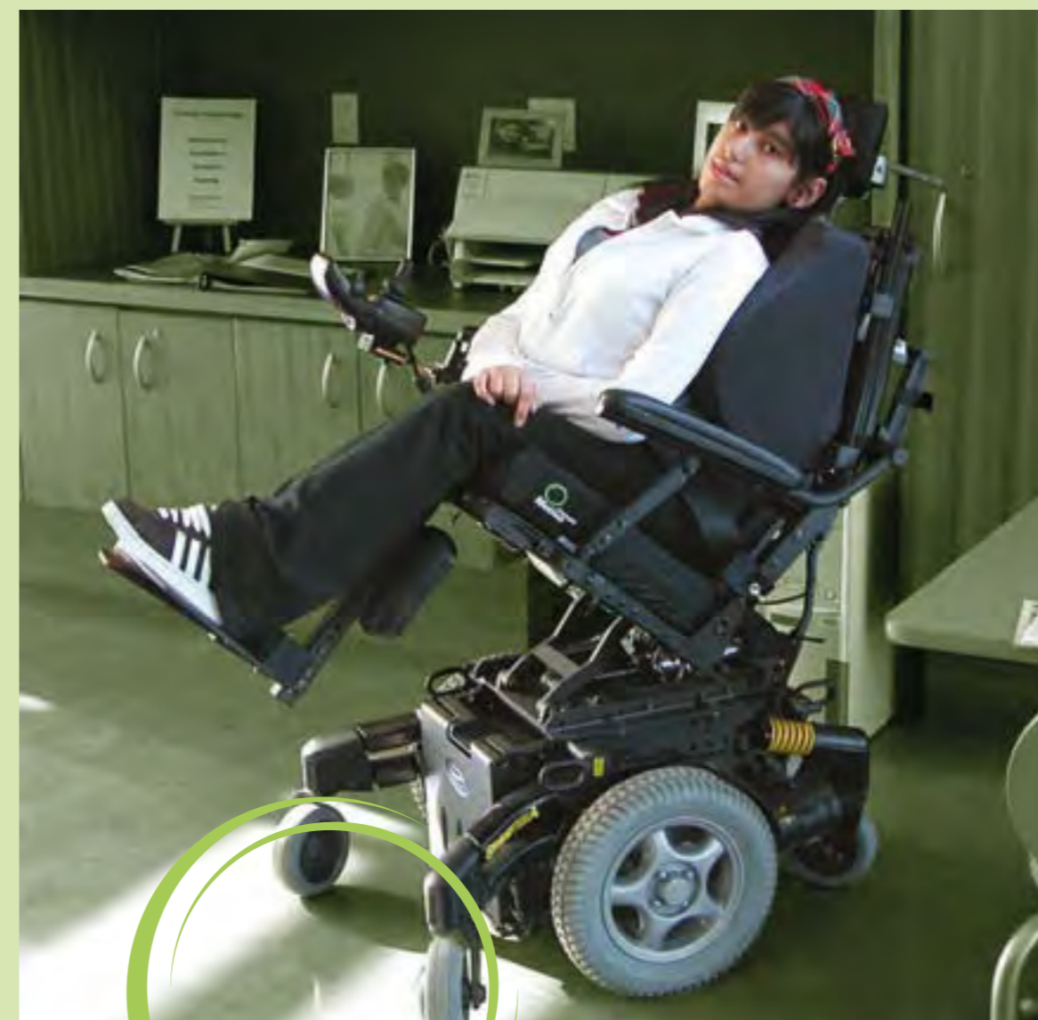
Vielseitig: Die Sitzsysteme von Motion Concepts können auch mit einer individuellen Sitzschale ausgestattet werden