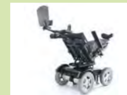
Kombinationsfreudig: Vielfältige Funktionen des Sitzsystems ermöglichen eine optimale Sitzposition