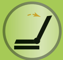
Rückenwinkel einstellbar bis zu maximal 174 Grad zwischen Sitz und Rücken