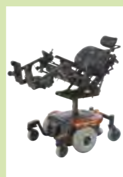
Säulenlift: Elektrische Sitzhöhenverstellung bis zu 20 cm für einen erweiterten Aktionsradius