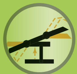
Horizontal-Positionierung mobilisiert Nutzer in Bauch-, Rücken- oder Seitenlage