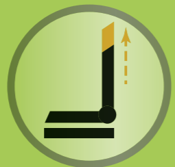
PSB – ermöglicht die Selbststeuerung von Auf- und Abwärtsbewegungen der Rückenlehne