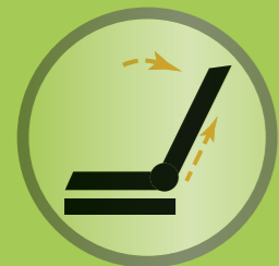
HPMSR – verhindert Scherbewegungen zwischen Rückenlehne und Rücken