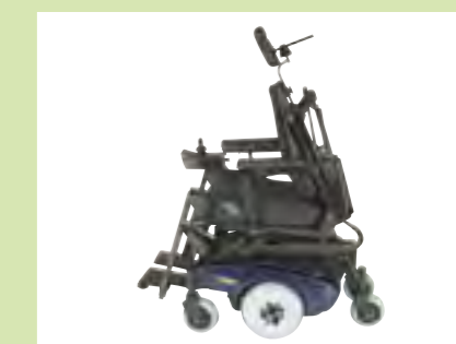
Vorneigung: Geringer Rückenwinkel gegen Streckspastiken