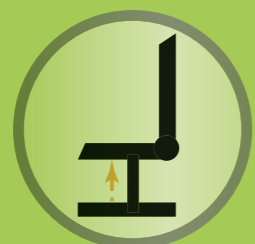
Säulenlift ermöglicht elektrische Sitzhöhenverstellung um bis zu 20 cm