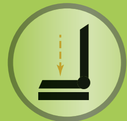
Niedrige „Seat-to-floor“ (STF) Sitzhöhe für einfachen Zugang z.B. unter einen Tisch