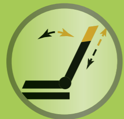
ESR – Längenausgleich der Rückenlehne verhindert Scherbewegungen zwischen Nutzer und Rückenlehne