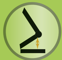
Sitzflächenvorkantelung ermöglicht eine Vorneigung des gesamten Sitzsystems bis zu 30 Grad