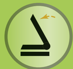
Vorneigung stufenlos einstellbar zur Reduzierung des Sitz-/Hüftwinkels unter 90 Grad